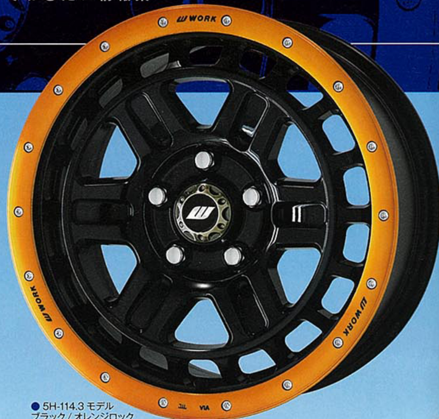
●5H-114.3モデル ブラック/オレンジロック