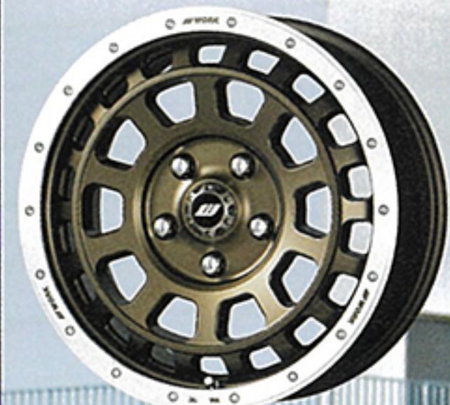
● 5H-114.3 モデル アッシュドチタンカットリム