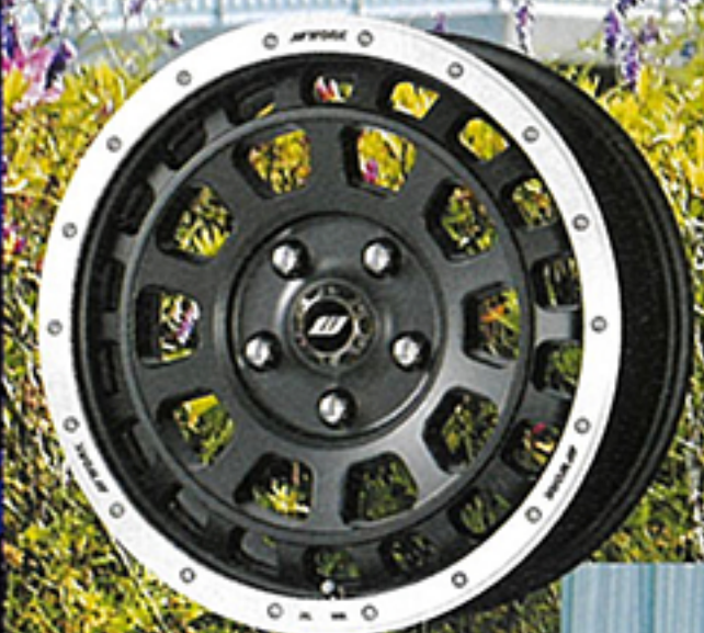
● 5H-114.3 モデル マットカーボンカットリム