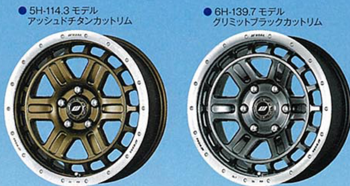
●5H-114.3モデル アッシュドチタンカットリム