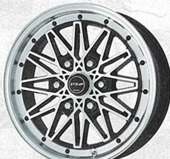
ブラックカットクリア (17インチ)

スピンのままでと働くクルマのハイエースだが、ノーマル車高からほんの少しイジってアルミホイールを履かせると、アラ不思議。これががぜんカッコよくなる。ココでやめときゃいいものを、エスカレートしてエアロやオーバーフェンダーを付けてと、カスタムの沼にハマる。ビジネスユースに徹したハイエースはムダを削ぎ落したスクエアでプレーンなフォルムゆえ、どんなカスタムをも許容する懐の広さがある。