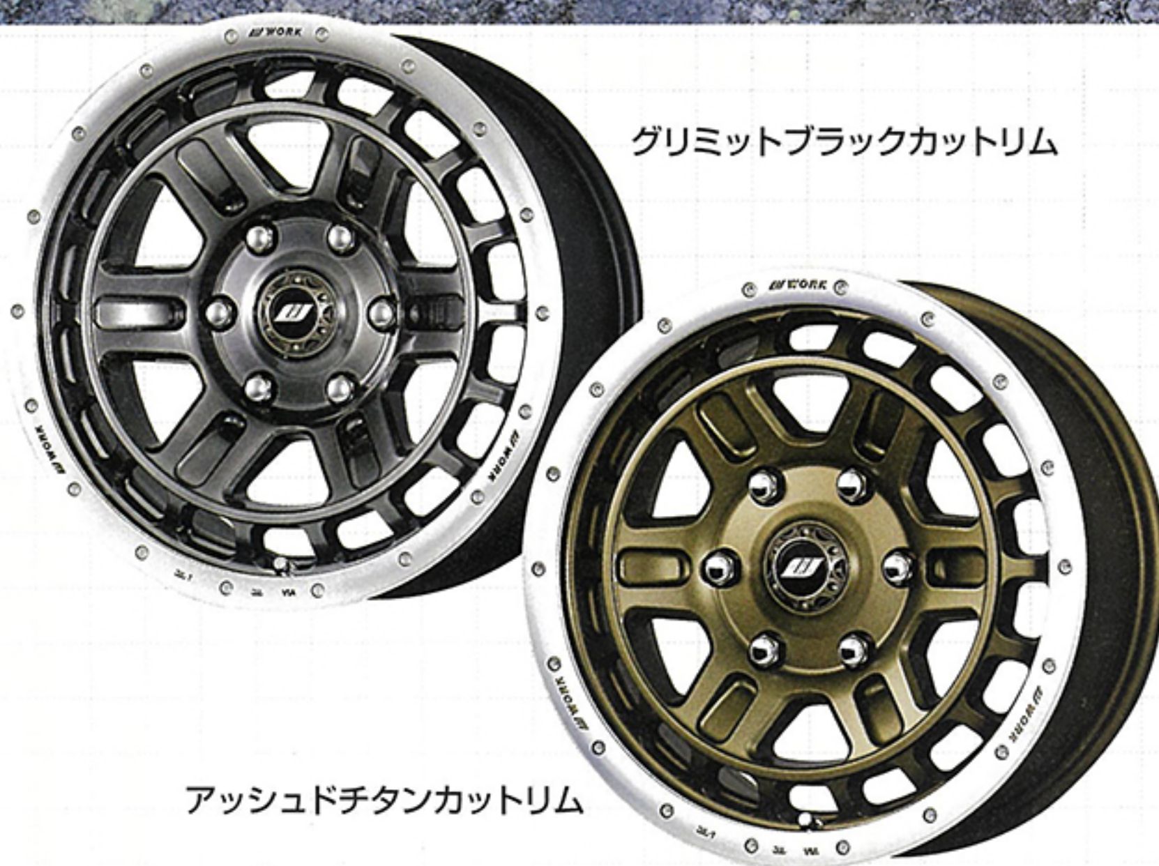
グリミットブラックカットリム