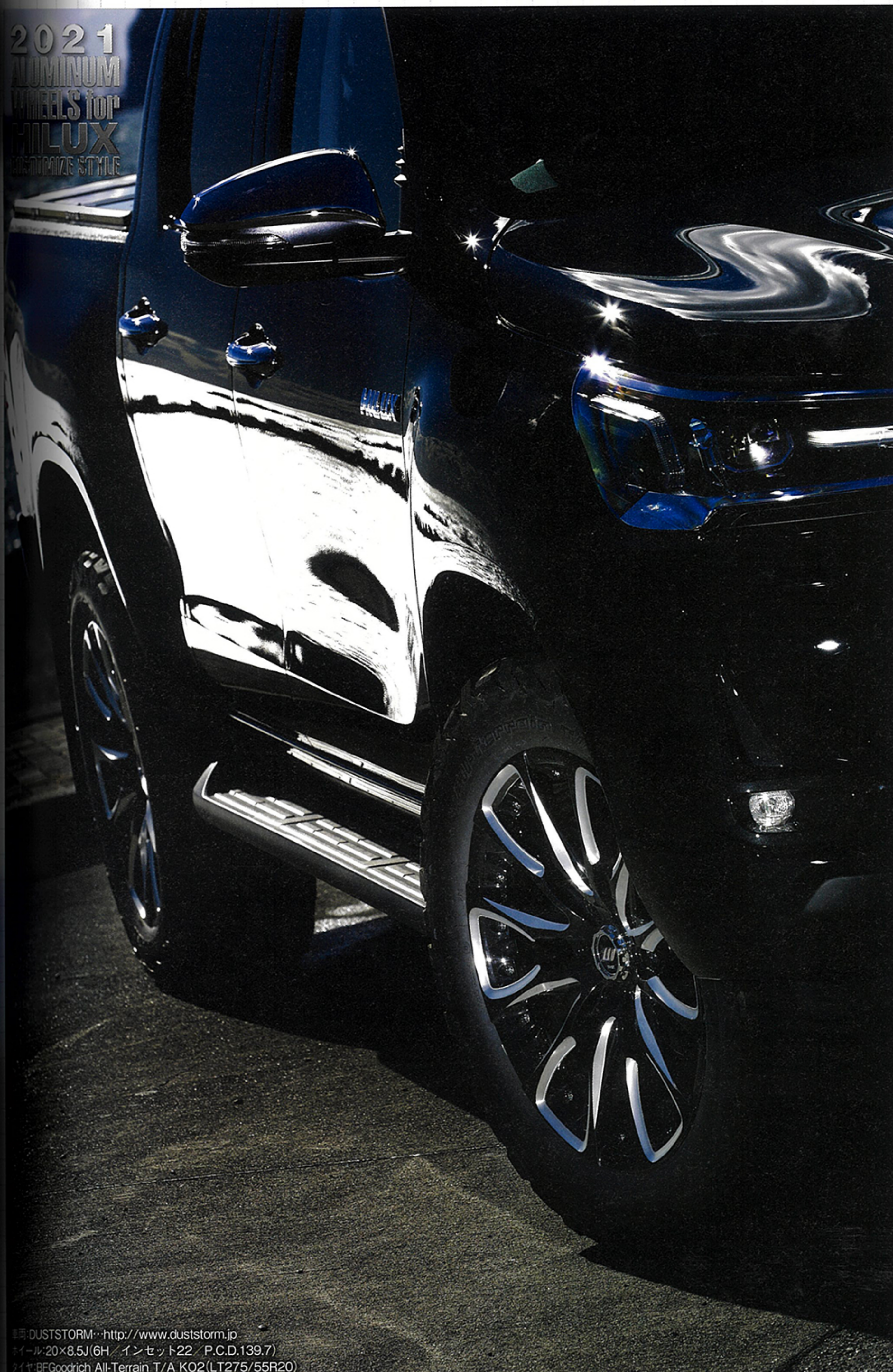
車種: DUSTSTORM / http://www.duststorm.jp ホイール: 20×8.5J(6H/インセット22/P.C.D.139.7) タイヤ: BFGoodrich All-Terrain T/A KO2(LT275/55R20)

グな印象を演出している。加えて、エアバルブをあて、リム周辺のピラスボルトのデザインに溶け込ませることで、流麗な美しさが際立つ造形に。実用車としてのイメージが強いハイラックスだが、PSVを履かせるだけで、都会的で洗練されたスタイルに変身することは間違いない。これまでのCRAGシリーズとは一線を画すデザインからドレスアップホイールと思われそうだが、JWL・T規格をクリアした本格オフロードランにも対応した本格派なのである。