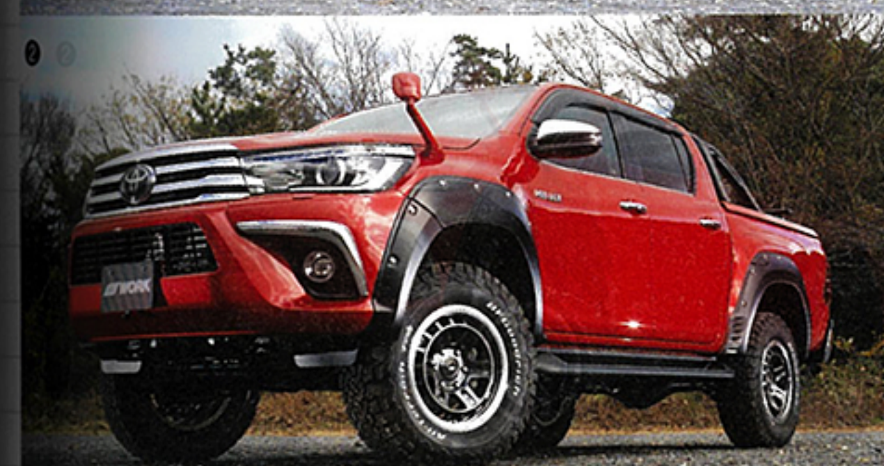
①アッシュドチタンカットリム ②グリミットブラックカットリム