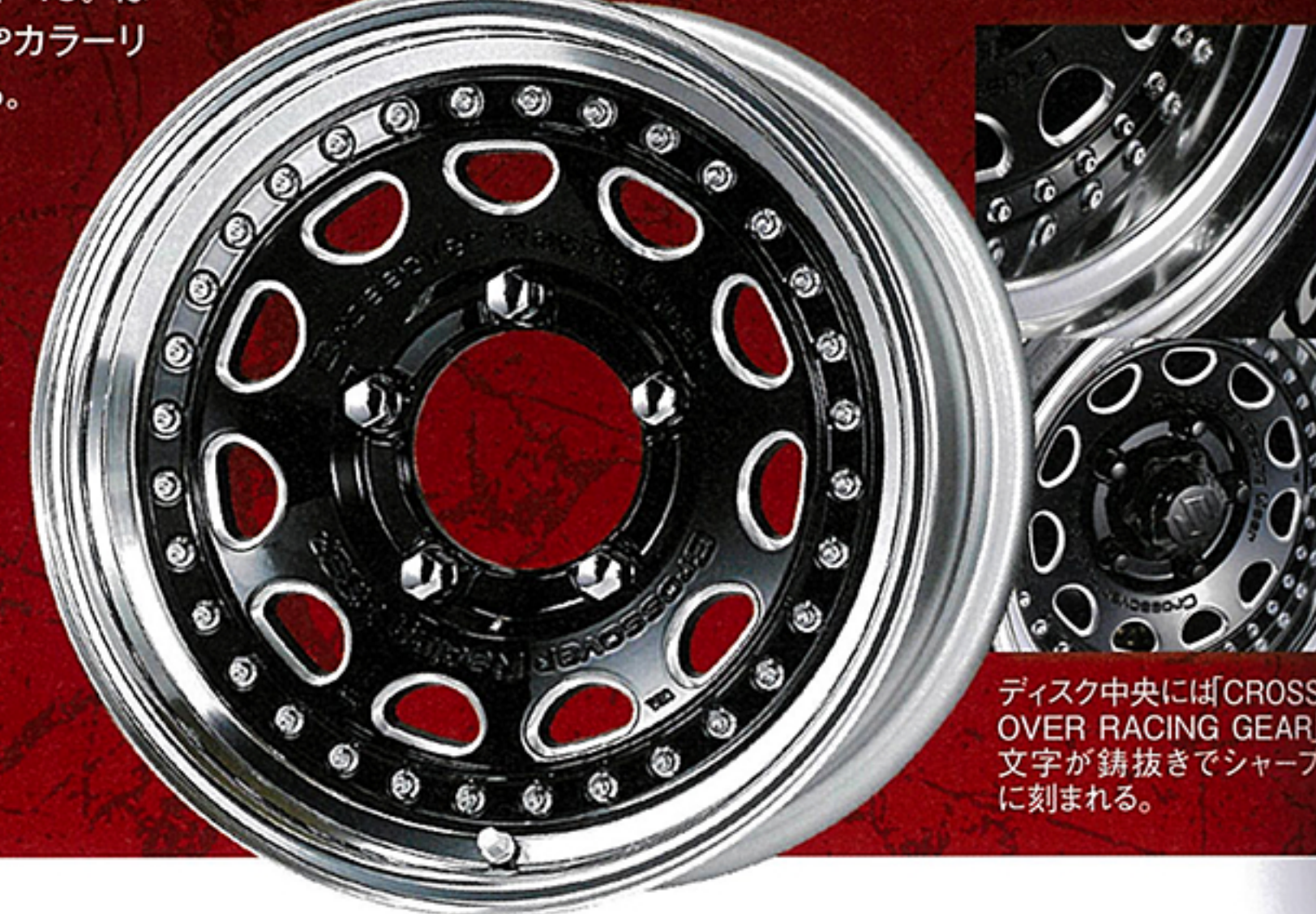
ディスク中央に「CROSS OVER RACING GEAR」文字が鋳抜きでシャープに刻まれる。

GALVATREは、CRAGシリーズの源流に当たるモデルを踏襲した、本格派の3ピースホイールになります。基本のディスクカラーは王道のカットクリアとブラックシャンファーマシニングの2色ですが、多彩なセミオーダーカラー12色に加えて、リムバリエーション6種、ピアスポルト3種、センターキャップ2種(5H-114.3のみに設定)までを揃えています。(WORK 渡邊さん)