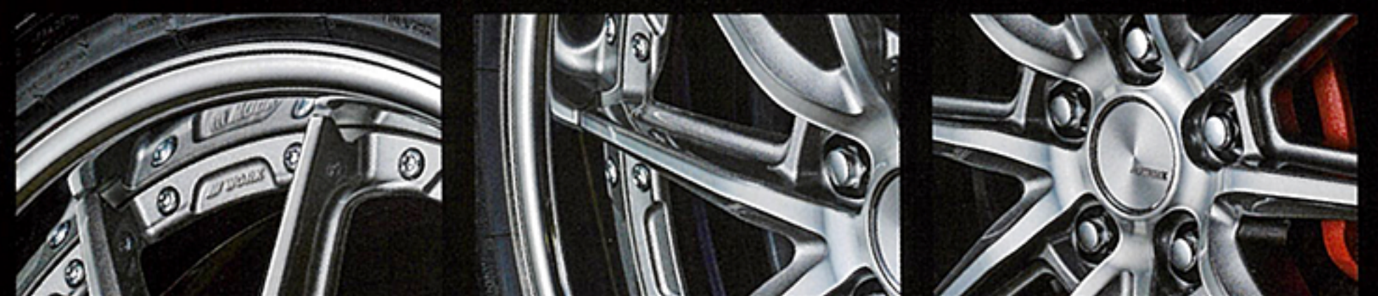
リムに映り込んだ際に軽快感を出すため、スポークの先端をアンダーカット処理。ピアスポルト間のへこみは立体感の向上にひと役買う リムに向かうほど細くなるよう仕立てられたスポーク。多角的なデザインも特徴で、スポーク周囲の光を受けやすく様々な表情を見せる シンプルにまとめられた新設計のセンターキャップ。ナットホールはスクエアに見えるようにするなど、デザインにもこだわりが伺える

SPEC&PRICE(税抜) 18インチ(7.0J~12.5J) ● ¥55,000~¥67,000 19インチ(7.5J~12.5J) ● ¥66,000~¥77,000 20インチ(8.0J~12.5J) ● ¥77,000~¥87,000 21インチ(8.5J~12.5J) ● ¥94,000~¥103,000 ◎ P.C.D.&HOLE:114.3&5H、120&5H ◎ COLOR:ブラックカットクリア (BP)、 GRシルバーカットクリア (GRP)、グリミットブラック (GTK)