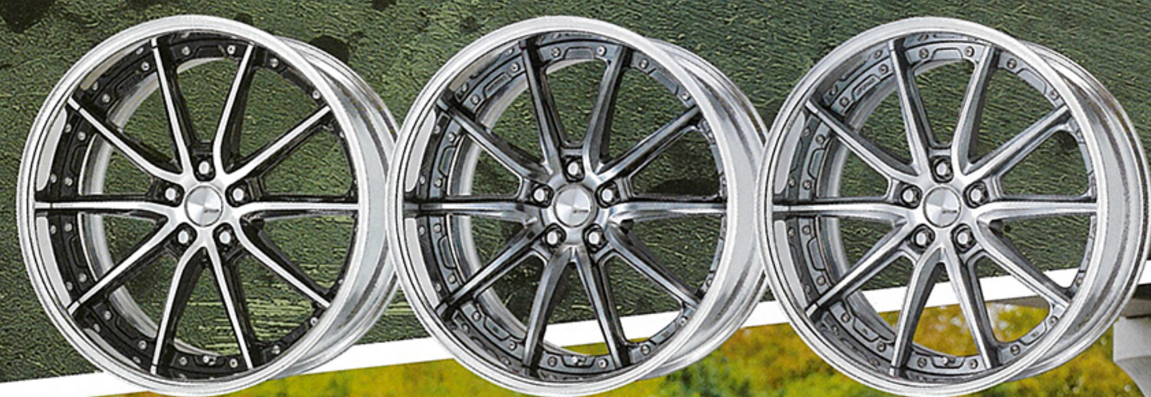
ブラックカットクリア (BP) + パファアルマイトリム (フルリバーズリム) グリミットブラック (GTK) + パファアルマイトリム (フルリバーズリム) GRシルバーカットクリア (GRP) + パファアルマイトリム (フルリバーズリム)