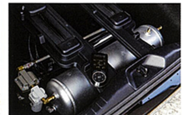
重量感あるLMルックにシャープなSG1ときたら、やはり車高は低い方がハマる。デモカーではイデアルのエアマックスを相棒に選択した

リフェクトでは、アル&ヴェルなら前後期間問わずにLM化が可能。塗装込みで約300万円からで、継続車検もOK。車種により要一部加工