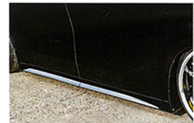
前後各部分はLM純正品を利用しているが、サイドだけはエグゼクティブラウンジ純正を使っているのもポイント。前後との相性はバツグンだ