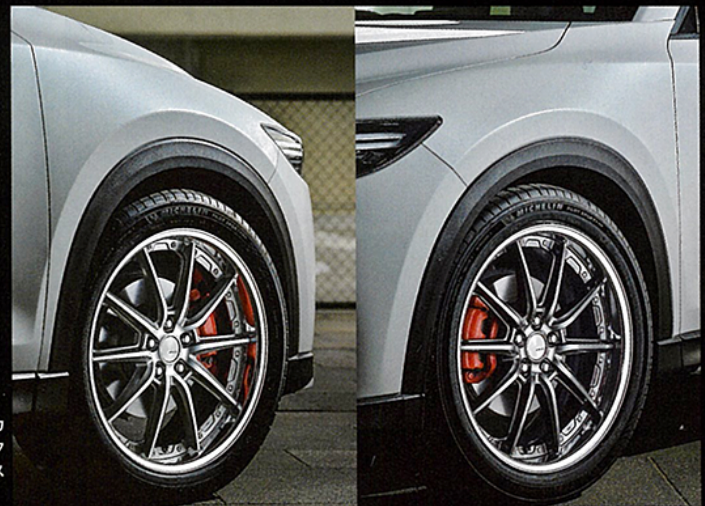
運転席側は新色のGRシルバーカットクリア。暗めのグレーのディスクに天面ポリッシュを施したコントラストを際立たせるカラーリング