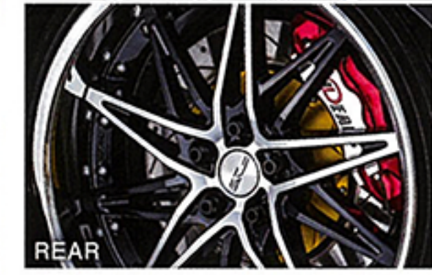
フェイスはあえてコンケーブではなくリム深度を確保できる形状を。デモカーではここにイデアルのブレーキも添え、オーラあふれる足元に