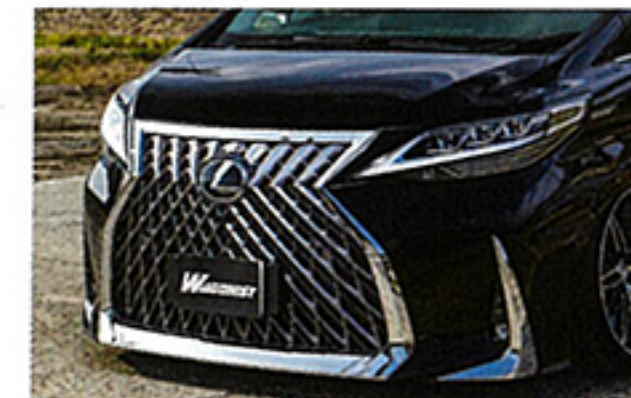
フロントはバンパーやヘッドライト、グリルなどをLM純正品へと交換。リヤもバンパーやコーナーパネル、ライナーなどをスワップした