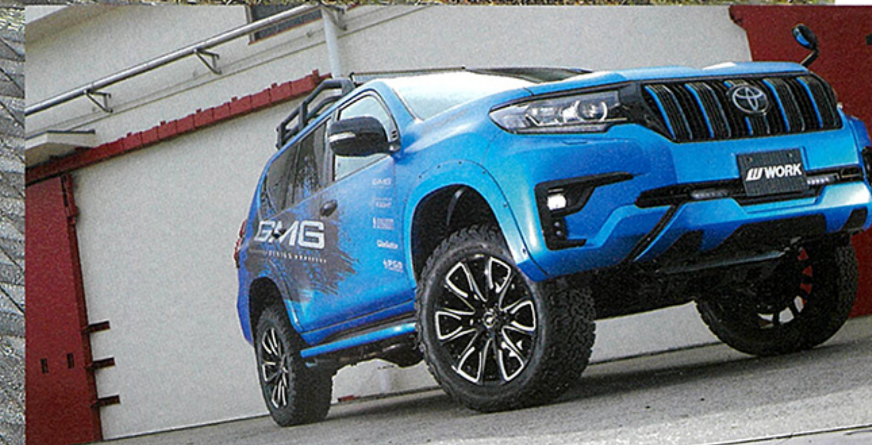
MODEL CAR ● LAND CRUISER PRADO 150 リフトアップ仕様 車両協力 ● GMG ( http://www.gmg88.com )