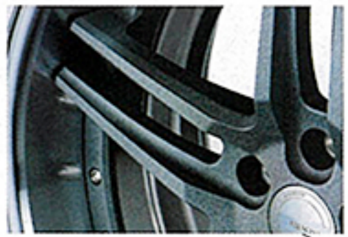
テクスチャーチャコールグレイ