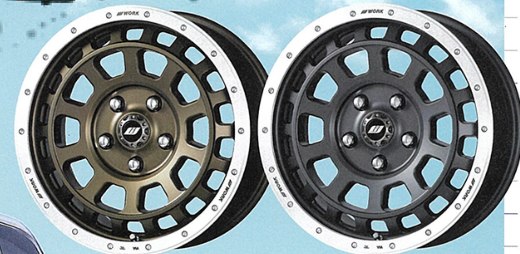
アッシュドチタンカットリム (AHGRC)