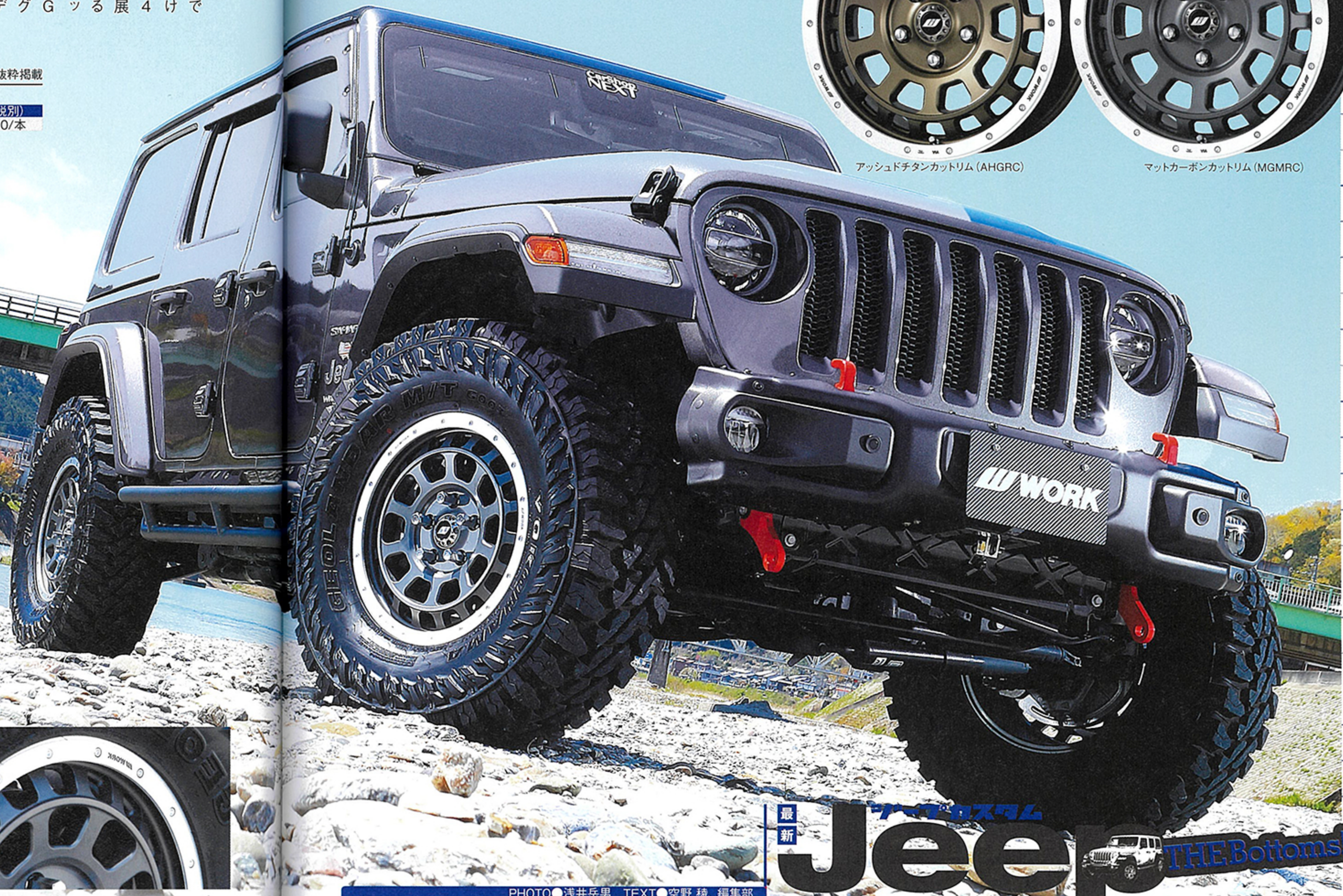
マットカーボンカットリム (MGMRC)