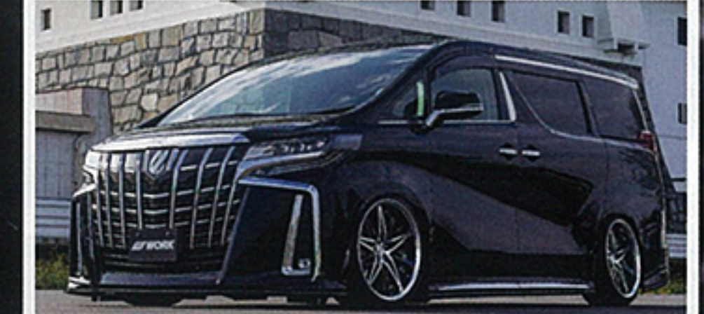
装着サイズ: (F)20x9.5-20 (R)20x9.5-5(ブラックカットクリア)