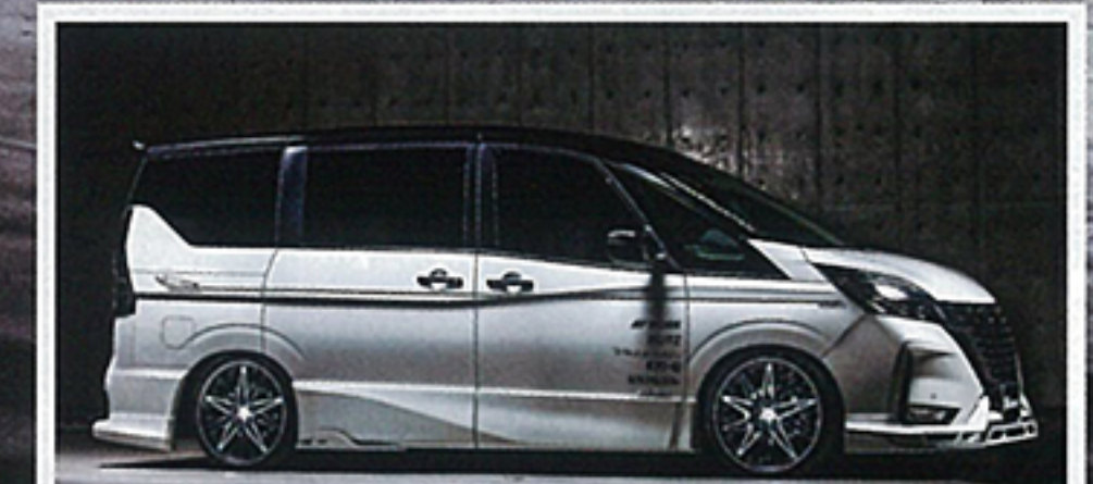
装着サイズ: (F)19x7.5-47 (R)19x7.5-37(ブラックカットクリア)

18~21インチとサイズレンジは幅広く、コンパクトからミドルクラス、シクラスまで相手を選ばずにすんわりハマるのも特徴である