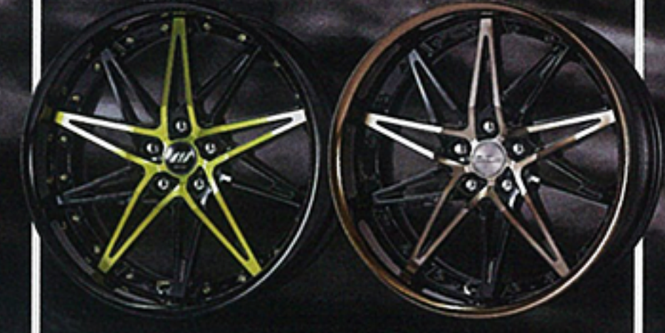
ブラックリアゴールド+ブラックアルマイトリム+オプションキャップ+Aset