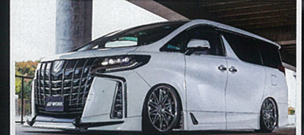
装着サイズ: (F)(R)20x9.5-32(グリミットシルバー)