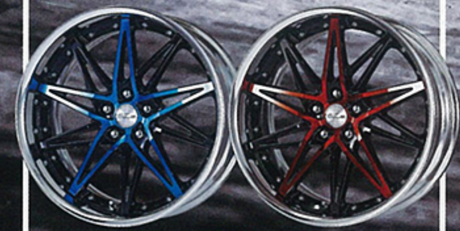
ブラックリアブルー

セミオーダーカラー・リムアクセントに対応するオプションも多数設定。2ピース構造だからミリ単位でインセットを指定できるのも魅力