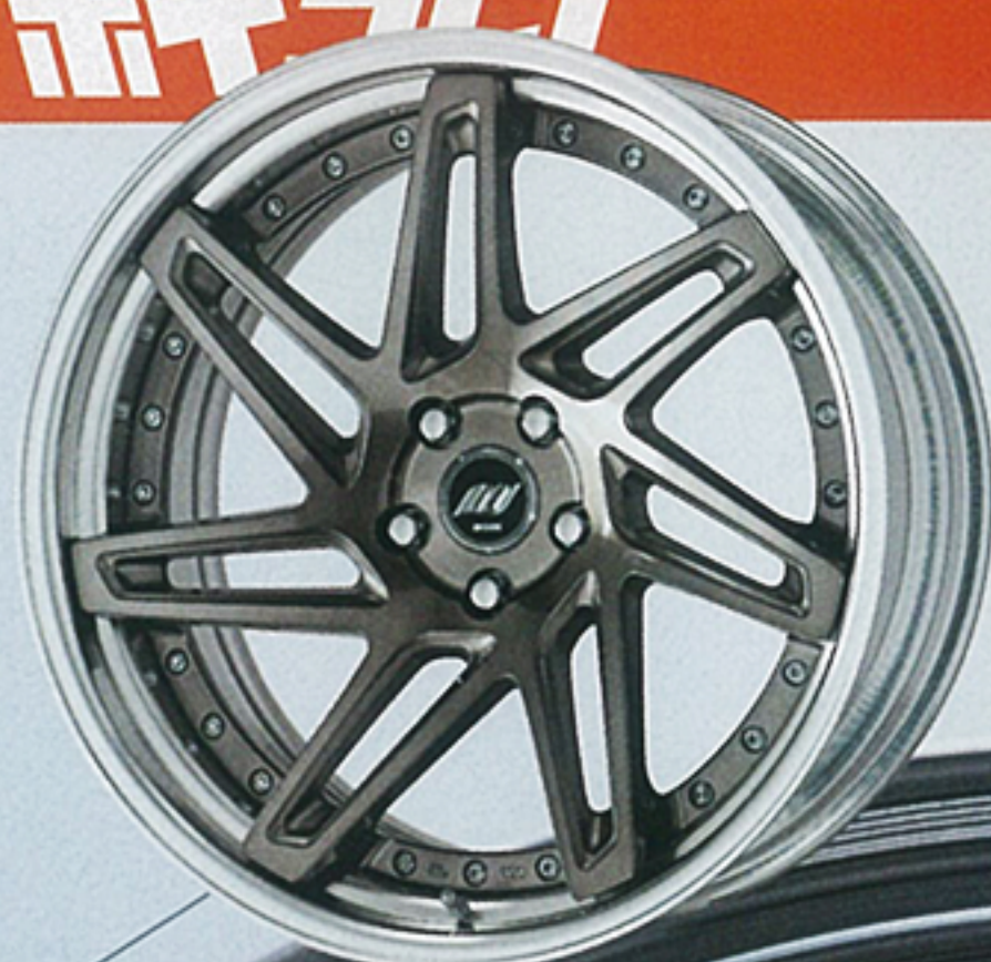
トランスグレーポリッシュ