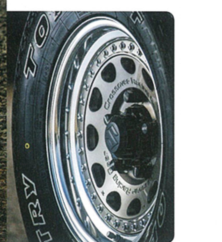
アール基調なドーム型の窓が独特で、フェイスは旬のコンケイフ。ディスクでは12色のセミアオーダーカラーが選択でき、個性追求が可能