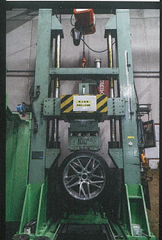
ワーク基準 1010kg/落下高さ14センチ (対JWLでは義務なし)

直方向からの衝撃を受けたあとに突如制動試験、90度衝撃試験の後、変形半直方向負荷耐久試験を行う。JWL基準で義務はないものの、ワークでは試験を義務化。