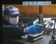
ディスクもワーク独自の検査測定を行う。14項目に及ぶチェックをクリアした後、塗装やバリ付けなどの最終処理の加工に移る。