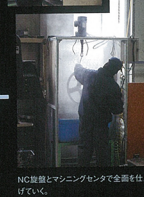
NC旋盤とマシンニングセンターで全面を仕上げている。