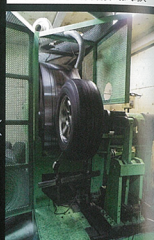
ワーク基準 60万回転 20% UP (対JWL基準)

直方向の負荷を想定した疲労耐久試験。JWL基準が60万回転のところ、ワーク160万回転を義務化。