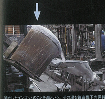
溶けたインゴットの湯を注ぎ、その湯が鋼温で保持槽に流し込む。