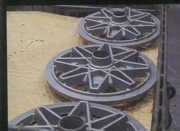
時効処理を行う。この処理により製品レベルの硬さを手に入れる。