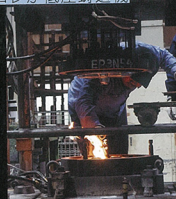
成形に用いた湯は、低圧で金型に湯を充填させ成形していく。