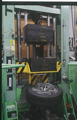
ワーク基準 255mm 約10% UP (対JWL基準)

斜め方向からの衝撃を再現した衝撃疲労試験。ディスクの疲労耐久試験。JWL基準が高さ230mmからの落下のところ、ワーク基準が高さ255mmの高さ。