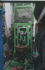
ワーク基準 15万回転 50% UP (対JWL基準)

ハンドホールに切り欠き部に割れが発生するディスクの疲労耐久試験。JWL基準が10万回転のところ、ワーク10万回転に対し、ワーク基準は15万回転。