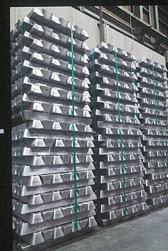
ディスクの素材として使用するインゴット。