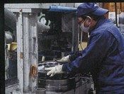
焼き入れ時に起こるディスクの変みを修正し、バリをとる。