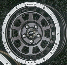
マットカーボンカットリム