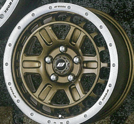
アッシュドチタンカットリム