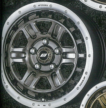
グリミットブラックカットリム

歯車のようなスポークパターンを二重に並べた革新的な意匠が特徴。ヒードロック風アウトワリムフランジには、ロゴも刻印される