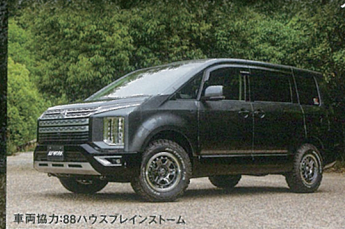
車両協力:88ハウスプレインストーム

Tグラビックの背景やスペックを踏襲し、より強靭にブラッシュアップしたモデルがこのTグラビック2。Tグラビックよりも6mm絞り込んだ外側のスポークは、細かな石などが詰まらず、軽量化にも寄与するための構造。リムフランジ天面を曲面とし、強度と剛性も高められている。