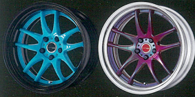
エナジウム 【ブラックアルミトリム】 アスリウムレッド 【オパールキャップ】

ワークではオスカー・メーダー・ブレンとエクス・トラ・ヘルクと名を冠した2ピースのカスタマイズメニューを用意。複雑な形状にもディスタンスがセレクトされる2ピースだから、従来のホイールに劣らない性能も実現できる。カスタマイズの幅は無尽大だ。