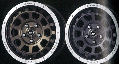
アッシュドチタンカットリム

バハ1000やアジアナリーなど、奇能なオフロード・コンペティションを踏破することを目的に、WORKのすべてのノウハウが注がれて開発された「CONCEPT T-GRABIC」。コンペティションモデルはフル鍛造1ピースドロック構造のハイスベック仕様となるが、その遺伝子を受け継ぐべく、市販モデルとして還元されたのが「CRAG T-GRABIC」だ。ボディは鍛造1ピース構造。ディスク面はコンペティションモデルしながらの、“ダブルギアスポークデザイン”。イン側とアウト側で開口部数を変え、二重に重なる歯車のような、独自のエアバランスだ。さらにリム部も、フランジのピンスポルトと、ビードロックリング“風”の演出で、タフさと力強さをアピールしている。もちろん規格もJWL-Tをクリアするなど、実用上も十分な強度耐久性だ。カラーはアッシュドチタンカットリムとマットカーボンカットリムの2タイプ。