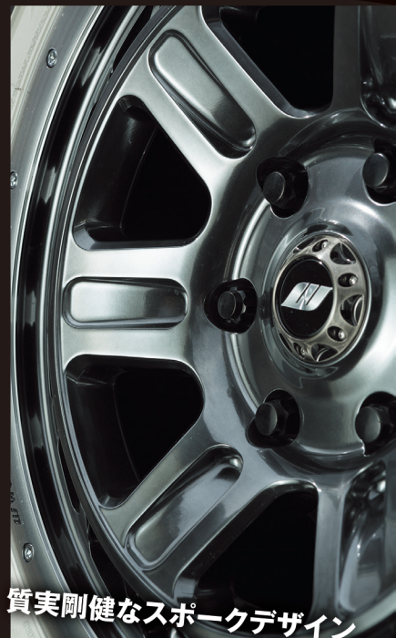
質実剛健なスポークデザイン