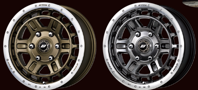
アッシュドチタンカットリム グリミットブラックカットリム