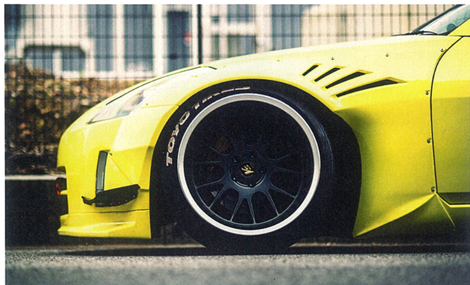
WHEEL サイズ : 19 x 7.5J ~ 15.0J ¥85500 ~ ¥108000、20 x 7.5J ~ 13.0J ¥95500 ~ ¥112000

WORKは世界中で愛される日本ブランドとして、高いデザイン性と日本ならではの高い品質を貫いてきた代表的なブランド。近年盛り上がるこのUSDM/STANCEシーンにおいても、WORKを愛用するユーザーは日米共に多く、誰もが一度は目にしてきたホイールブランドのひとつだ。今回紹介するのは2017年のSEMAで発表された3ピースとして、2018年5月に日本でもスタートしたVS TX。オーバーフェンダーブームの過熱に伴い注目される極太リムをカバーする心強い味方としてオススメの一本。リムアレンジやセミオーダーカラーや特殊PCDに対応してくれるカスタムオーダープランもあるので、ぜひチェックしていただきたい。