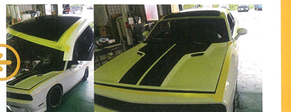
改めてボディを見てみるとアチコチにキズや凹みが発見されたため、まずは板金塗装を行ったチャレンジャー。下地もままのオーバーフェンダー・サイドスカート・リアスポイラーも同時にボディと同色にするため塗装し直し。その際はラジックの工程へ。