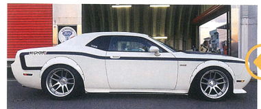
塗装から戻ってきたオーバーフェンダー・サイドスカート・リアスポイラーを順に装着しつつホイールも合わせてインストール。サイドのグラフィックが一部削いだのは追加で税金処理が必要になったため。そしてリアスポイラーの装着が一番最後の工程となった。