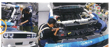
第一印象を決めるフロントフェイスにもメスを入れる。ヘッドライトには元々LEDリングが取り付けられていたが、よりハッキリとした目にするためLEDリングを新規施工。さらにグリル内にはEDGEのロゴイルミを配置するため加工。ライトを点灯した際は発光体存在を視認する。