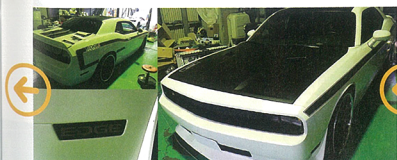
ラジックを施すのはフード・ルーフ・トランクの3箇所。フードとトランクは完全カスタムが施され、ルーフは4枚のブラックだったため、すべてにマットブラックのフィルムを張り一体感を出す。ボディサイドにはエッジカラムスのオリジナルグラフィックを施工。