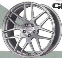
GROSIS FMB03 FORGED MONOBLOCK

■ GROSIS FMB01, FMB02, FMB03 / 19 インチ ●鍛造1ピース●PC.D.: 9H+12 ●19×8.0J+8.5J+9.5J+10.5J+11.0J ●規格: 1.8-127700+8-1.8-1427700 1.8-15770000+1.8-16270000 ●19×8.5J+9.5J+10.5J+11.0J ●規格: 1.8-127700+8-1.8-1427700 1.8-15770000+1.8-16270000 ●カラー: ベンジンブラック/グランドブラック/ブラック