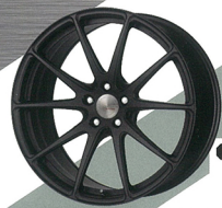
GROSIS FMB01 FORGED MONOBLOCK