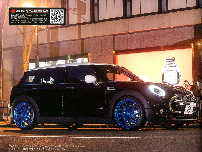
F54クラブマンには20インチホイールがピッタリなだけの訳じゃない。車体の幅が広いのもあり、フェンダーアーチが付いているので20インチでも違和感なく馴染む。