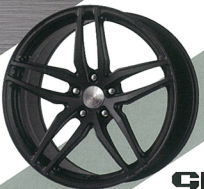
GROSIS FMB02 FORGED MONOBLOCK