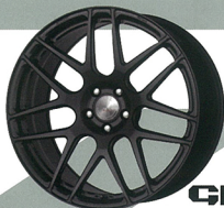
GROSIS FMB03 FORGED MONOBLOCK

■ GROSIS FMB01, FMB02, FMB03 / 20 インチ ●鍛造1ピース●PC.D.: 9H+12 ●20×8.5J+9.0J+9.5J+10.0J ●規格: 1.8-13720000+8-1.8-15770000+1.8-16270000 ●19×8.5J+9.0J+9.5J+10.0J ●規格: 1.8-127700+8-1.8-1427700 1.8-15770000+1.8-16270000 ●カラー: ベンジンブラック/グランドブラック/ブラック