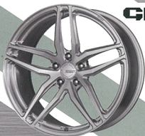
GROSIS FMB02 FORGED MONOBLOCK