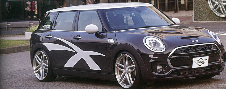
F54クラブマンにFMB02 20×8.5J ブラックJTDを装着。タイヤはゴヨウインフレイク。