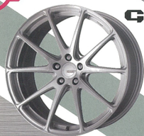
GROSIS FMB01 FORGED MONOBLOCK