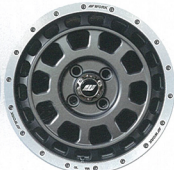
マットカーボンカットリム (MGMR)