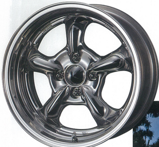
ハンドパワフィニッシュ (BBF)