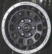
マットカーボンカットリム

カラー（FR）を車体と同様に3色に大きな装飾性を備えたカーボンカットリムとアッシュドチタンカットリムを既定「RUM」を継ぎ足し「カーボン」の相性もUVカットとマットカーボンでしっとり主張し、オフロードタイヤのコンビネーションにマッチ。