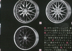
01. ディスクの接合部を内側に向けたデザインとしたことで、深リム感を演出。02. フランジ部にはより鋭い立ち気味のデザインを採用。03. スポークはピレット感の演出により、エッジで独特の輝きを演出している。04. センターキャップ周辺にはナット部分が深く設定されており、よりディスクが落ち込まれたイメージのデザイン。