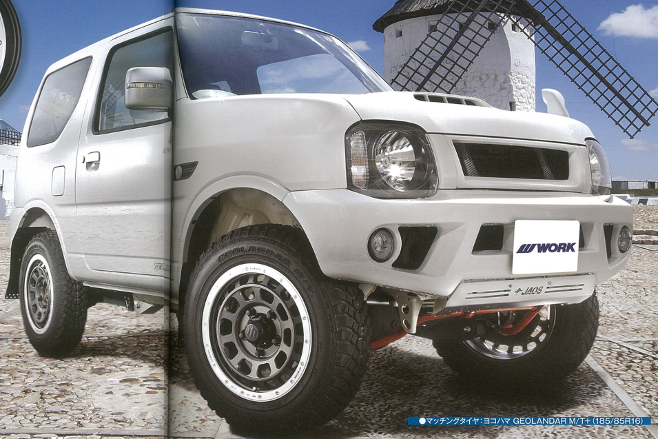
●マッチングタイヤ:ヨコハマ GEOLANDAR M/T+(185/85R16)

オフロードホイールに新風を巻き起こしている、ワークのCRAG(クラッグ)ブランドのT-GRABIC(ティーグラビック・Baja(ハハ)1000やアジアXCR(アール)への参戦車両に供給したホイールをベースに開発すると、モータースポーツのイメージも強い。また、ビードロッキング形状のリムフランジなども、コンベクションを彷彿させる要因。それゆえ、オフロードをカウリングする様なカスタマイズ車種と非常に良いマッチングを示すのだが、実は街乗りをメインとするスタイルとも、実に見事なフィットングを見せる。写真のジムニーのような街乗りを快適にするカスタマイズを施したJBL23Wにおいて、T-GRABICはチャレアイテムとしての機能を果たしている。その印象は、実際に街乗りにもマッチするスタイルに変身した、設定される標準カラー2色は、マットカーボンカットリムとアッシュドチタンカットリムとなる。