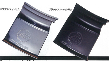
パワフルマイルド プラックマイルド

全てのリムに施工し、リムの色や仕上げによって見え方が変わるが面白い。唯一無二を実現する究極のメニュー。エッジコートとレーザーカットが特徴となる。