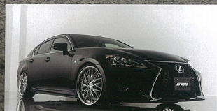
10本スポークが流麗な表情は、高級セダンにみられる存在感を放つ。

この車は、最新のデザインに合わせ、革新的なデザインと技術革新の融合で誕生したモデルだ。 この車は、最新のデザインに合わせ、革新的なデザインと技術革新の融合で誕生したモデルだ。