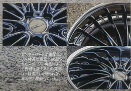
※カラーは専用 の専用塗装で、 ボディカラーに 合わせてお選び いただけます。 ※タイヤは別売