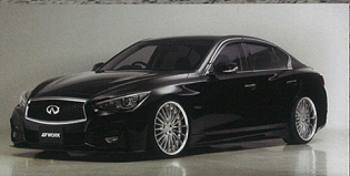
レグニッツは、様々なフォルムを持つ現行車にのみ採用されるモデルと云えるだろう。

その繊細な20本のスポークは、水の流れを表現する繊細な20本スポーク。また、シルキーメタリックシルバー、フリアブロードシルバーブラックの専用塗装で、ボディカラーに合わせてお選びいただけます。タイヤは別売。 この車は、最新のデザインに合わせ、革新的なデザインと技術革新の融合で誕生したモデルだ。