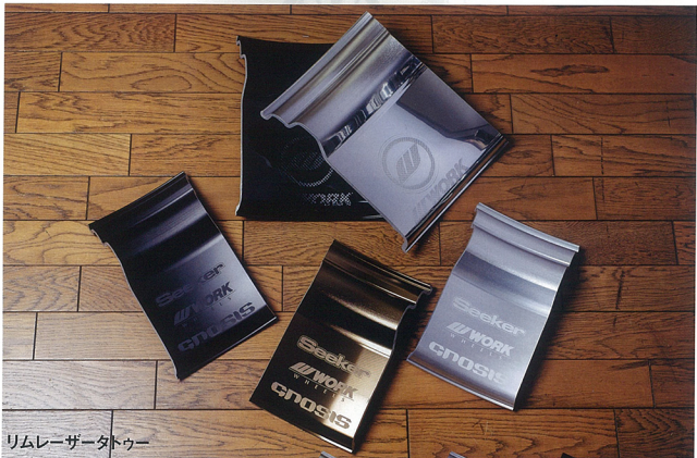
リムレーザーカット