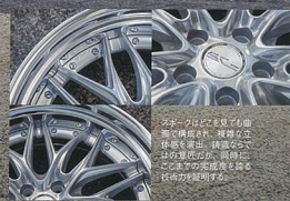
※カラーは専用 の専用塗装で、 ボディカラーに 合わせてお選び いただけます。 ※タイヤは別売