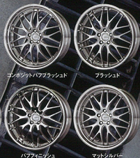
コンクエストハーフブラッシュド