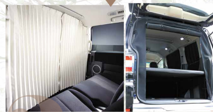
便利なアイテムが勢揃い

スーパーステアリングやサスペンション、内外装パーツなど、カスタマイズアイテムが大充実する4WD・SUVだが、アウトドアに便利なアイテムも多くリリースされている。例えば車中泊をより快適にするベッドキットや、ウインドーのカタチに合わせた防虫ネットやカーテンなど。やはり4WD・SUVはアウトドアで使ってこそだ。