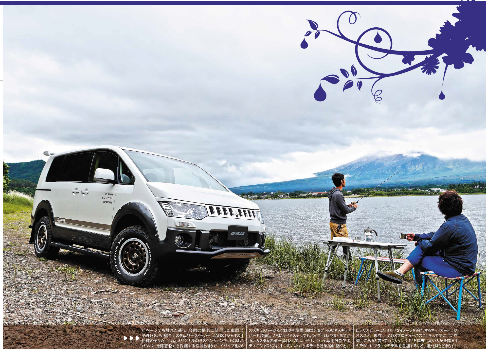
前ページでも触れた通り、今回の撮影に使用した車両は4WD・SUV 総合カスタムパーツメーカー「JAOS(ジャオス)」仕様のデリカ D:5。オリジナルのサスペンションキットのほか、バンパーを障害物から保護する役目を担うガードパイプ形状のスキッドバーがたくましさ増幅(同コンセプトのリヤスキッドバーも装着)。さらにサイドステップもパイプ形状でまとめている。カスタムの第一歩目としては、デリカ D:5 専用設計でボディにジャストフィット、泥ハネからボディを効果的に防ぐと共に、リアビューにワイルドなイメージを追加するマットガードⅢがオススメ。現在、JAOSプロデュースのD:5はすでに「完成型」にあると言っても良いが、2016年末、高い人気を誇るリヤラダーにブラックモデルを追加するなど、進化はとどまらず!

新しい世界を開くカギは すでに手の中にあった ...そんなわけで、アウトドアと無縁の生活をしてきたオーナーが突然キャンピングやフィールドスポーツに目覚めたり、逆にウィンタースポーツやアウトドアが好きだから、4WD・SUVをチョイスしたら、一層その魅力にハマってしまった、なんてのはよく聞く話だ。やはり、4WD・SUVは単なる移動の手段ではない! 日常から非日常へアクセスするための頼れる相棒であり、自己主張のファッションであり、さらにライフスタイルを変えてしまいうくらい大きな存在なのだ。 アウトドアといえば、やっぱりキャンプ。河原や山奥の大自然の中で行なうのが非日常感たっぷり。で良いが、家族や彼女、仲間たちと気軽に楽しむならキャンプ場に行くって手段でもアリ。一から十まで揃った近代的な施設もあるが、中には大自然ほとんどそのままのたいな場所も探せばあったりする。また、キャンプに行くほどの時間や都合が許されないなら、宿泊しなくても楽しめるデイ・キャンプやBBQもオススメだ。 さらに、一歩先行く達人になるなら、「ヨンク×アウトドア」というテーマにふさわしい、今回の旅のような林道ツーリング&キャンプに出掛けるのがベスト。スノーアタックに次いで、林道ツーリングはもっともイメージなオフロードランの機会だが、普段は感じられない愛車のポテンシャルを十