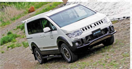
ラフロードを走れる

オフロード走行に強いこと。これも4WD・SUVたるアドバンテージだ。高い最低地上高と、対地アングルが稼がれたボディワーク、4WDシステムなどにより、自然のもう少し奥までのアプローチを可能にしてくれる。この性能を利用しない手はない! 日常ではない非日常への扉を開けるカギといっても過言ではない!