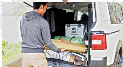
室内空間を有効に使える

大型SUVはもちろん、ミドルサイズにおいても4WD・SUVは広い室内空間が確保されている。1列目から2列目まで余裕のある居住性、そしてシートアレンジも多彩で、乗員と積載する荷物に無理なく合わせることができる。ではジムニーなどの軽SUVは? 2人乗車と割り切ってしまうは意外に使えるのだ!