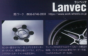
センター部分がステン仕上げとなるセンターキャップ。標準は黒だけでなく、オプションでクロム(オーナメント設定あり)。

20インチがすべてのモデルの標準サイズですが、21インチの充実も、21インチの要望を受けて、このたびは21インチの標準色を追加することになりました。また、ランベックのLM1は車系やボディ色が手紙をなびた。車体の大きさに合わせて、21インチの追加は効果的。ランベックの中では一番の個性派である「ホク」のLM1の中心径が広がる。また、ランベックの中心径を21インチに標準のLM1と統一させた。