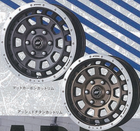
マットカーゴネットリム

アメリカの消防車というイメージを、リアルな消防車というイメージで再現した。カラーマットカーゴネットリム(マットチタンカットリム)を採用したほか、その外周は、一段下げたオフロードスペックで構成されている。カラーマットカーゴネットリム(マットチタンカットリム)を採用したほか、その外周は、一段下げたオフロードスペックで構成されている。