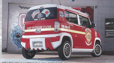
過酷な競技で使われた圧倒的クォネス・スペックで走り出すポイント