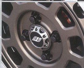
リムにカラーマットカーゴネットリム(マットチタンカットリム)を採用したほか、その外周は、一段下げたオフロードスペックで構成されている。