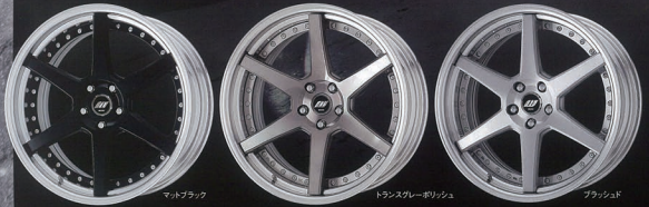
マットブラック トランスグレイ・ポリッシュ ブラッシュド

ZEAST ST1 SIZE & PRICE 18インチ(7.5J-11.5J) ● ¥68,040~¥92,890 18インチ(B.D.J)-11.5J ● ¥79,920~¥103,880 20インチ(B.D.J)-11.5J ● ¥90,720~¥114,480 21インチ(B.5J)-11.0J ● ¥109,080~¥136,080 COLOR: マットブラック、トランスグレイ、パールホワイト