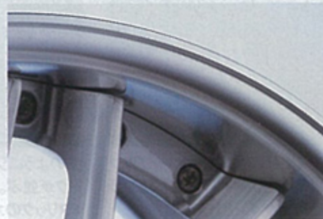
ディスク外周にピアスポルトを配置したことで高級感を高める。このピアスポルトはGRシリーズに共通するポイント。