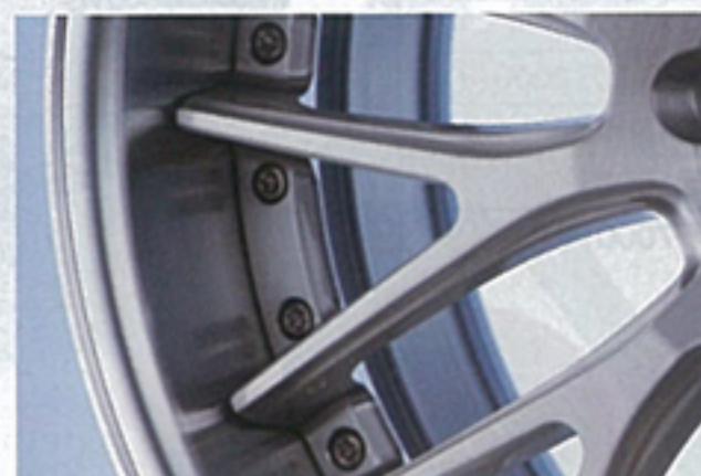
スポークはシンプルなメッシュデザイン。ディスク天面部をシリーズで最もシャープにし、よりスポーティなフォルムに。