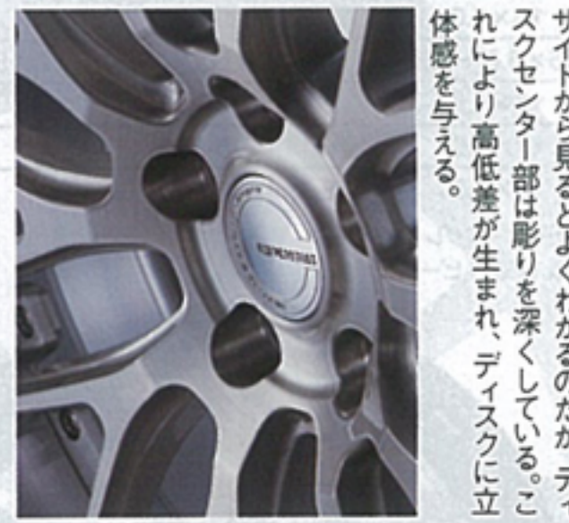
サイドから見るとよくわかるのだが、ディスクセンター部は彫りを深くしている。これにより高低差が生まれ、ディスクに立体感を与える。