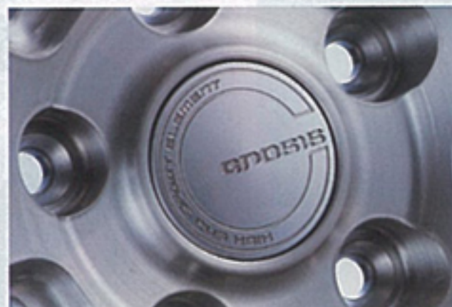
グノーシスブランドの証とも言えるセンターキャップ。ディスクデザインと同様にシンプルかつ上品な印象に仕上げられている。