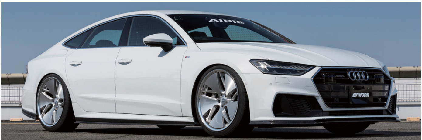
※装着画像はイメージです。