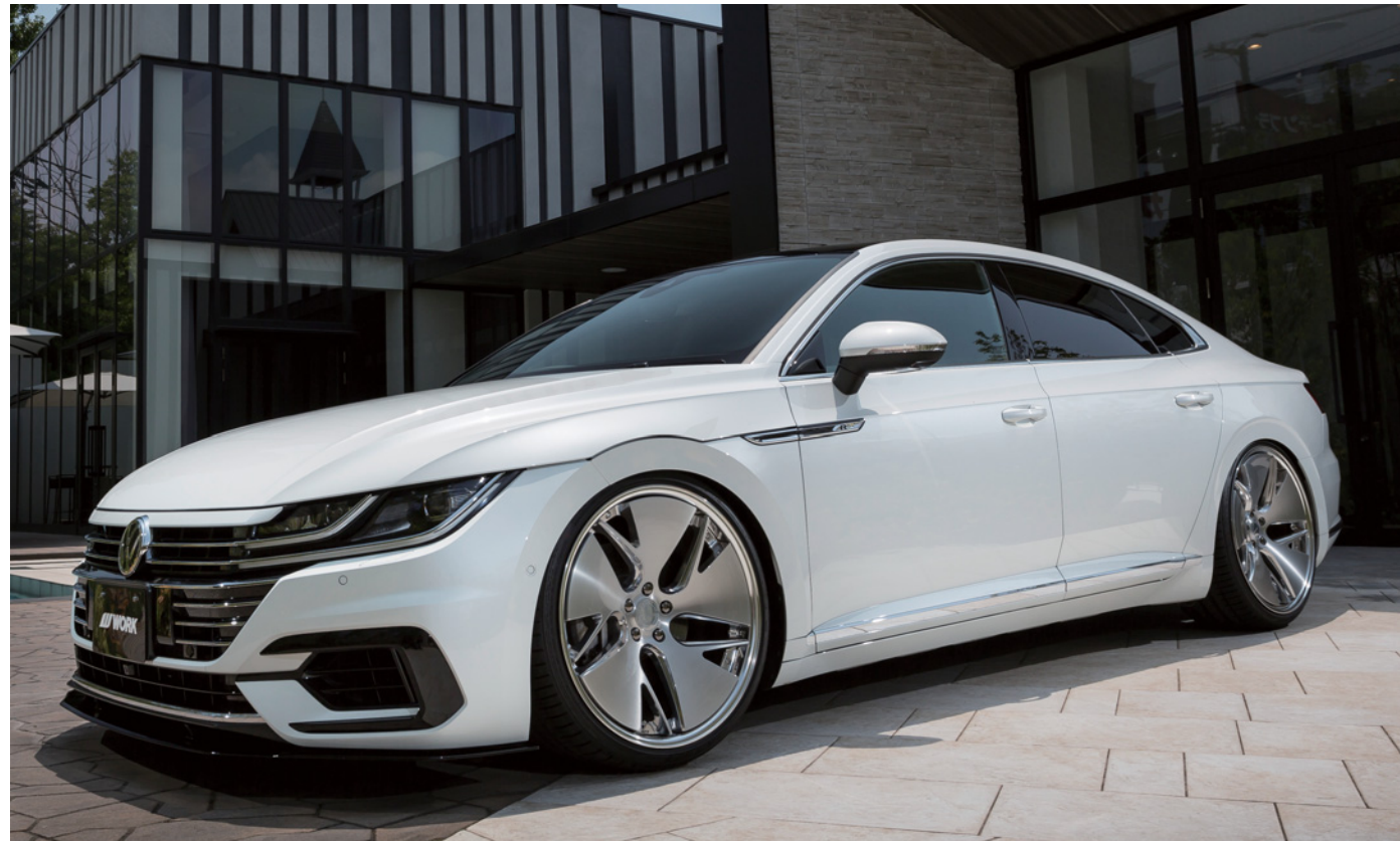
※装着画像はイメージです。