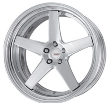
ブラッシュド (BRU) (ディープコンケイブ) (STEP RIM) 21 FORGED