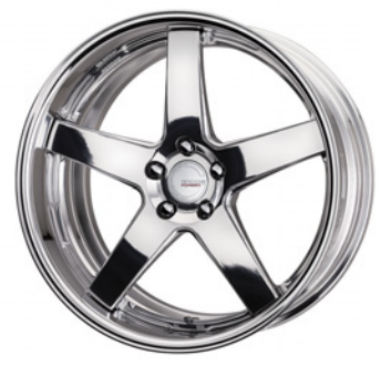
ハブフィニッシュ (PP2) (セミコンケイブ) 20 FORGED