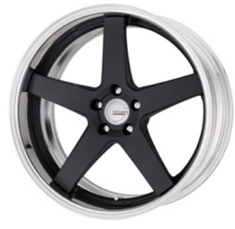
ブラックアノダイズド (SKA/B) (セミコンケイブ) 20 FORGED