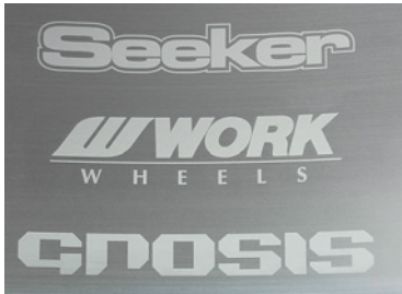
ブラッシュドリム