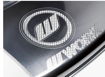
パパールマイトリム