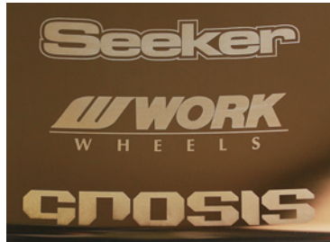
ブロンズアルマイトリム